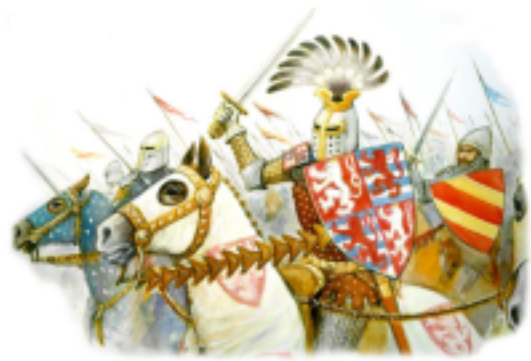
bitva u Kresčaku