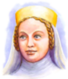
Blanka z Valois